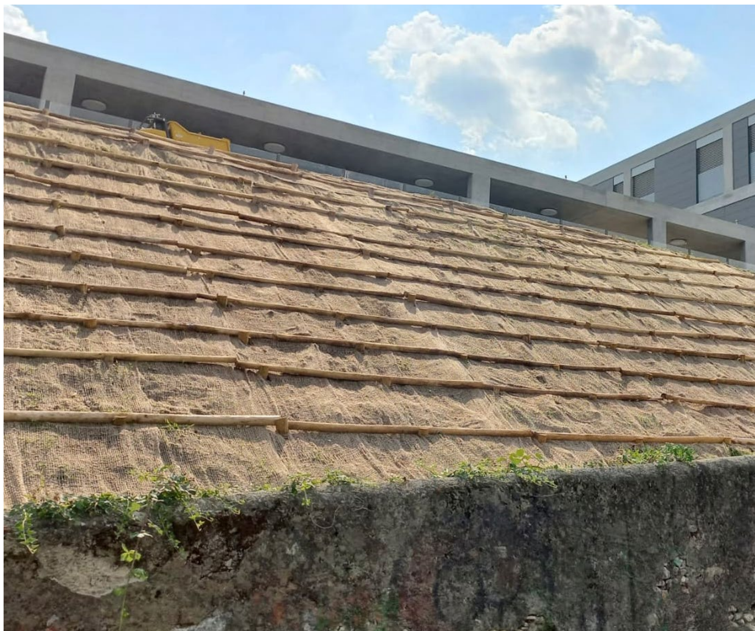
Consolidamento superficiale di scarpata con paleria in castagno. La posa dei pali, oltre che trattenere la terra, permetterà una più facile manutenzione. Lavoro eseguito da Edel Garten Sagl.

gettazione ci sia attenzione per le azioni costruttive necessarie e fondamentali , quali un buon drenaggio , un substrato profondo e terra vegetale di qualità , la predisposizione per un idoneo impianto di irrigazione e una corretta esposizione , il tutto in relazione alla tipologia di giardino che si vuole realizzare.