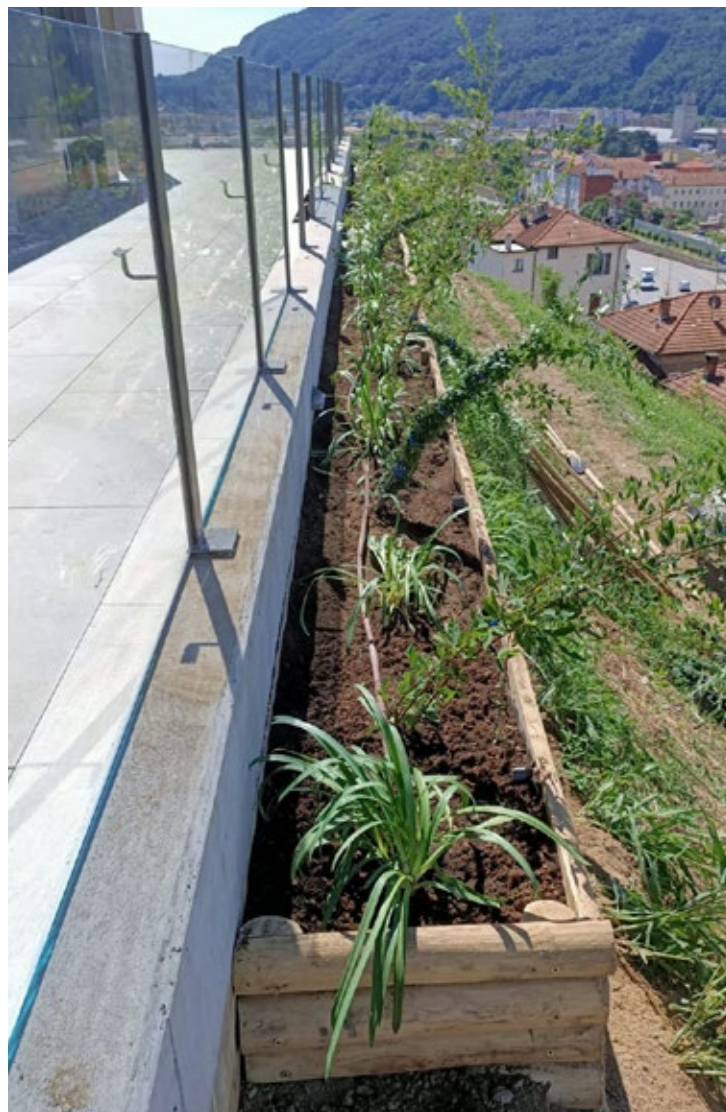
Fioriere su misura a copertura della corona di un muro in terre armate. Lavoro eseguito da Edel Garten Sagl.

problematiche quali le variazioni climatiche, l'inquinamento e l'ingerenza antropica, va preservato. Insieme a esso "salveremo" da una serie di interventi di manutenzione aggiuntivi anche la nostra area verde, che verrà a costituirsi come un ambiente naturale a nostra disposizione.