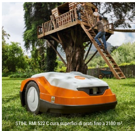
STIHL RMI 522 C cura superfici di prati fino a 2100 m 2 .

E la sicurezza? Dunque, parliamo di macchine che non hanno occhi, né orecchie, ma lame. E nel nostro giardino vogliamo sicuramente stare tranquilli che nessuno