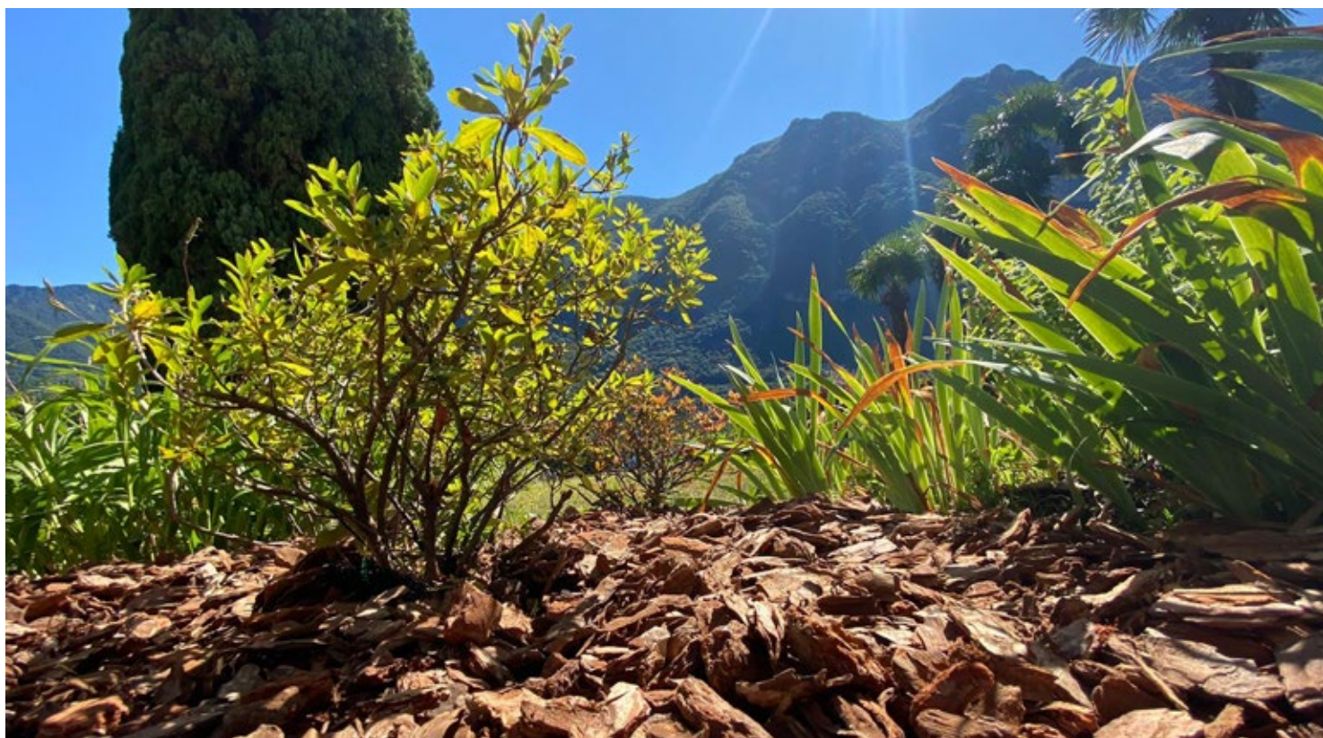
Aiuela personalizzata su richiesta del cliente. Lavoro eseguito da Società Anonima San Giorgio.

Ognuna di queste realtà, certamente complementari, è condizionata da un'imprescindibile problematica: la sua fattibilità .