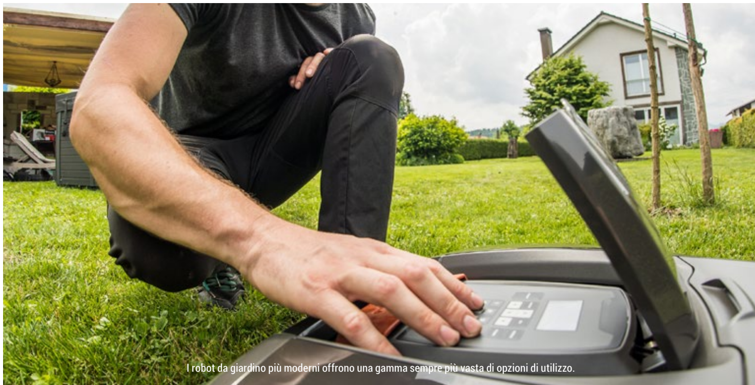
I robot da giardino più moderni offrono una gamma sempre più vasta di opzioni di utilizzo.

zino, online...oppure rivolgerti a chi vende i robot da giardino e affidarti ai suoi consigli. Per scegliere il robot potresti guardare il prezzo, l'estetica, le recensioni di altri utenti...oppure affidarti all'"esperto" che ti propone il modello più adatto al tuo