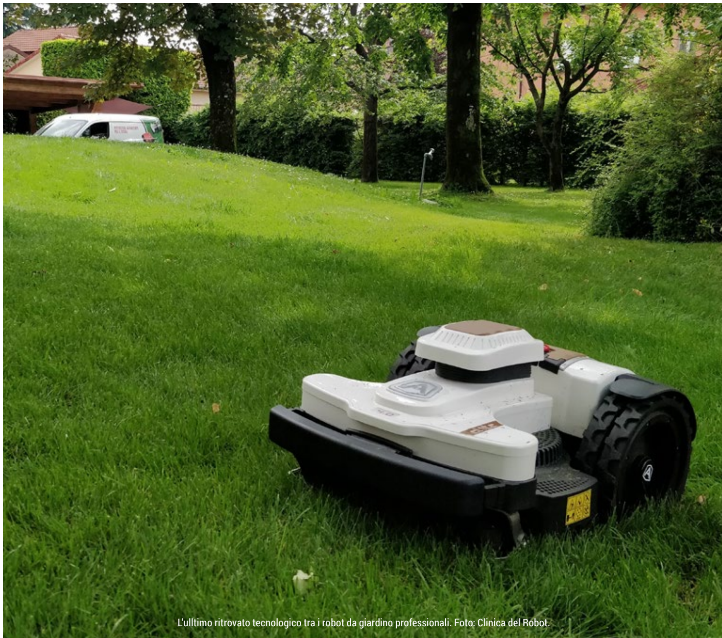
L'ultimo ritrovato tecnologico tra i robot da giardino professionali.

cializzato ha un prezzo di circa 1800.- chf, come può essere uguale al robot che online o al grande magazzino costa la metà? Va beh, deve solo tagliare l'erba, sì, ma come la taglia? In quanto tempo la taglia? Quanto durerà nel tempo? Perché quello che risparmi oggi, forse lo spenderai domani per sostituire il robot tanto performante ed economico che pensavi di aver acquistato.