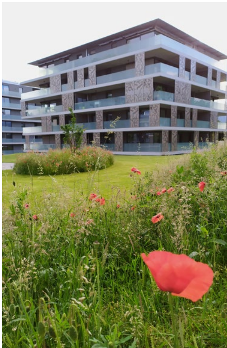
Parco/giardino nella regione della Gruyere. Lavoro eseguito da Aaelier Ribo.